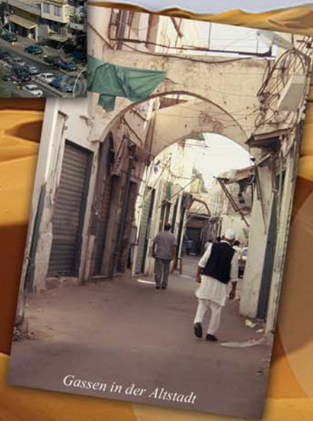
Gassen in der Altstadt

Mehr über die Autorinnen am Ende des Buches und auf www.Autorenprofile.de