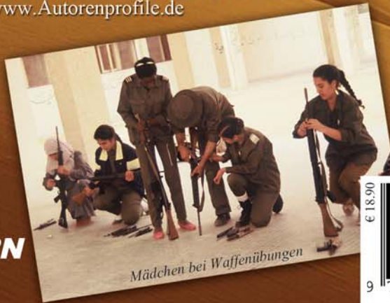
Mädchen bei Waffenübungen