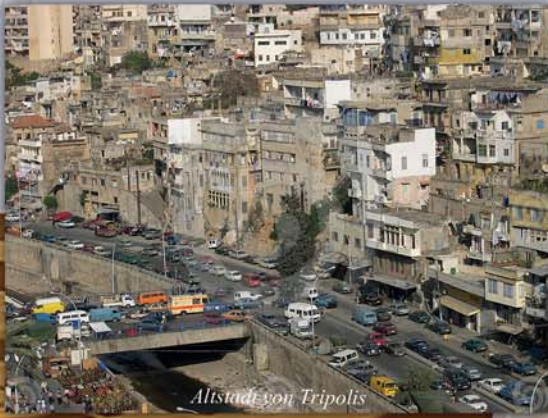
Altstadt von Tripolis

Mit diesem Buch werden Sie in ein unglaublich spannendes Reiseabenteuer entführt. Dabei zeichnen die Autorinnen ein facettenreiches Bild Libyens in den Jahren vor dem Umsturz und bieten neben ihren unterhaltsamen Erlebnissen im Land Gaddafis einen fundierten Einblick in die Infrastruktur, das politische Geschehen und das soziale Leben des zerrissenen Maghreb-Staates und seiner Bewohner.